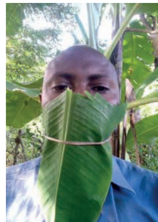
skolens præst har også humor Han har lavet en maske af bananblade!

De fattige skal også gå i kirke! Siden der er mange der går i kirke, skal der sys mange tusinde af masker.