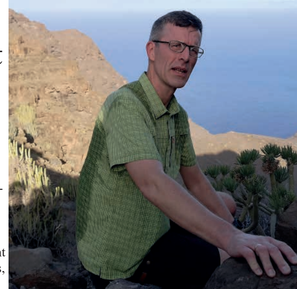
En lidt slidt forretningsfører efter hård bjergvandring

Den anden markante og skelsættende erfaring er cirka 15 år gammel. Jeg læste igennem Jeremias Bog, og pludselig stod nogle få ord i et vers frem for mig som var de bøjede i neon: »Gid der var et herberg for vejfarende i ørkenen.« (Jer. 9,1a).