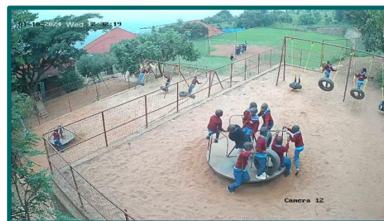
Kamera over legepladsens, som stadig er meget populær