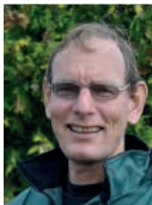
Af Peter Lanting, bestyrelsesmedlem