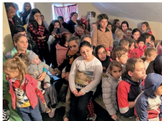
Fra mødet på første sal ...

I denne anledning vil vi gerne takke LMF for økonomisk støtte til arbejdet. Vi er meget taknemlige for, at vi har kunnet aflevere bibler til mange børn og hjælpe voksne med forskellige kristne materialer. Det er helt fantastisk, og på vegne af dem allesammen takker vi for hjælpen.