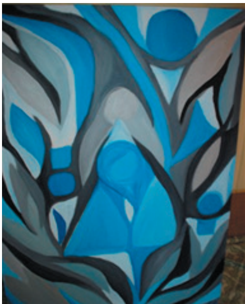
Wings of Compassion, (Barmhertigheds vinger) 60x80 cm, akryl på lærred, Elizabeth Padillo Olesen

OG: Når der betales kontingent eller man donerer gaver: Anfør venligst, hvad pengene er givet til. På forhånd tak!