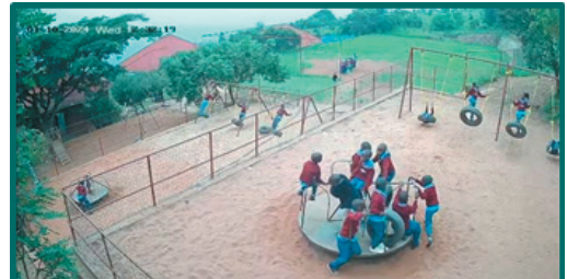
Kamera over legepladsens, som stadig er meget populær